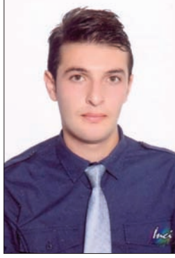
40643 MURAT ÖNAL ULUSLAR ARASI KIBRIS ÜNV.